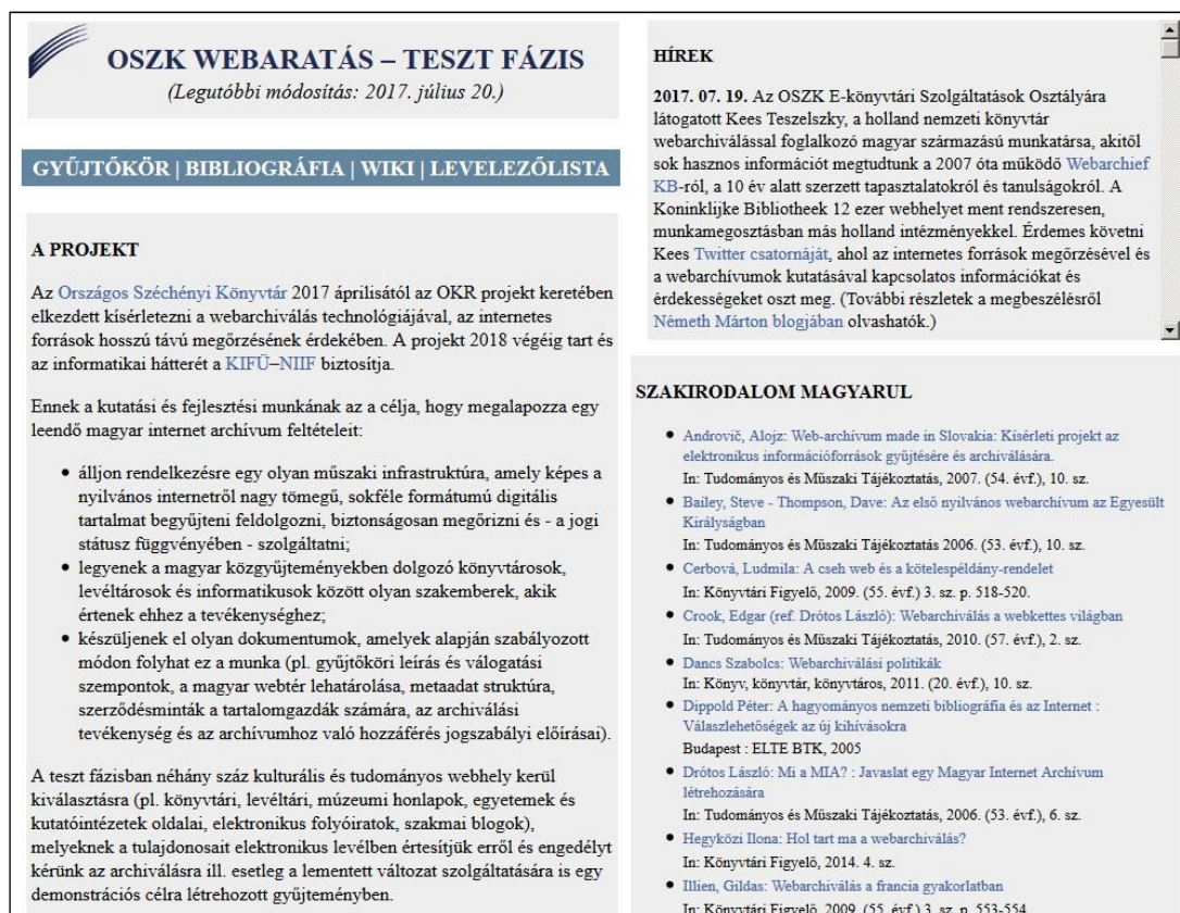
3. ábra Az OSZK-s webaratási pilot projekt ideiglenes weboldala

egy webaratási kísérlet: kb. 400 tudományos és oktatási intézet honlapját, valamint hírportálok anyagát mentették. A NAVA pedig néhány éve az MTVA számára gyűjt online sajtóhíreket. Az Országos Széchényi Könyvtárban az internetről (is) válogatott egyedi dokumentumok, kiadványok mentése és metaadatolása történik a MEK (könyvek – 1994 óta), az EPA (periodikák – 2004 óta) és a DKA (képek – 2007 óta) keretében. Bár már 2006-ban felmerült a webhelyek archiválásának a terve is, ehhez hosszú ideig nem sikerült forrást találni. 2017 márciusától viszont az Országos Könyvtári Rendszer fejlesztése keretében végre elindulhatott egy kísérleti fázisú webaratási projekt 2018 végéig, azzal a céllal, hogy megalapozza egy leendő, üzemszerűen működő magyar internetarchívum feltételeit. Egyelőre a technológia tesztelése, a külföldi jó példák megismerése, a szükséges elméleti és gyakorlati ismeretek megszerzése folyik. A projekt weboldalán 31 lehet tájékozódni a tervekről és az eddig elért eredményekről (3. ábra). Van itt egy wiki 32 is, amely az internetes források megőrzésével kapcsolatos fogalmakat, projekteket, szolgáltatásokat, szoftvereket, formátumokat, rendezvényeket, szervezeteket stb. ismerteti