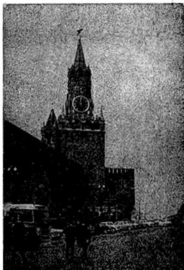
A Kreml toronyórája

Országos Műszaki Könyvtár és Dokumentációs Központ