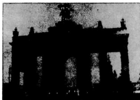
A Népgazdasági Kiállítás főbejárata

A Szpasszki torony kapuján át érünk a Vörös-térre. A Kreml hatalmas toronyórája már messziről üdvözölt bennünket. A Vörös-tér évszázadok óta a moszkvai élet központja. Itt tartják minden évben a május elsejei és a november hetedikünnepi felvonulásokat, katonai dísz-szemléket. Érkezésünkkor éppen áttörőváltást láthattunk.