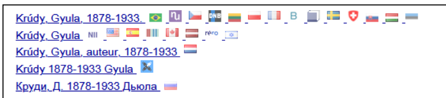
4. ábra Krúdy Gyula egységesített neve a VIAF-ban (Virtuális Nemzetközi Besorolási Állomány, http://viaf.org/ )

A kérdés valójában szorosan kapcsolódik az egyes nemzeti nyelvek jellegzetességeihez is. Ez a fogalmak szaktárgyszavakkal azonosított névválasztásában különösen megnyilvánul. A nevek tartalma nyelvenként nem teljesen azonos, ezért a jövő többnyelvű keresőrendszereiben komoly feladat lesz az összehangolásuk a többnyelvű névterekben.