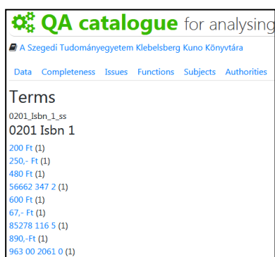
3. ábra A $1 almező a SZTE állományában

A 3. és 4. ábrán egy-egy nem létező, és inkoherens tartalmú almező példái láthatók.