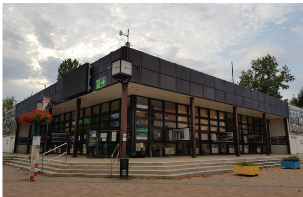
2. ábra A Békásmegyeri Közösségi Ház épülete