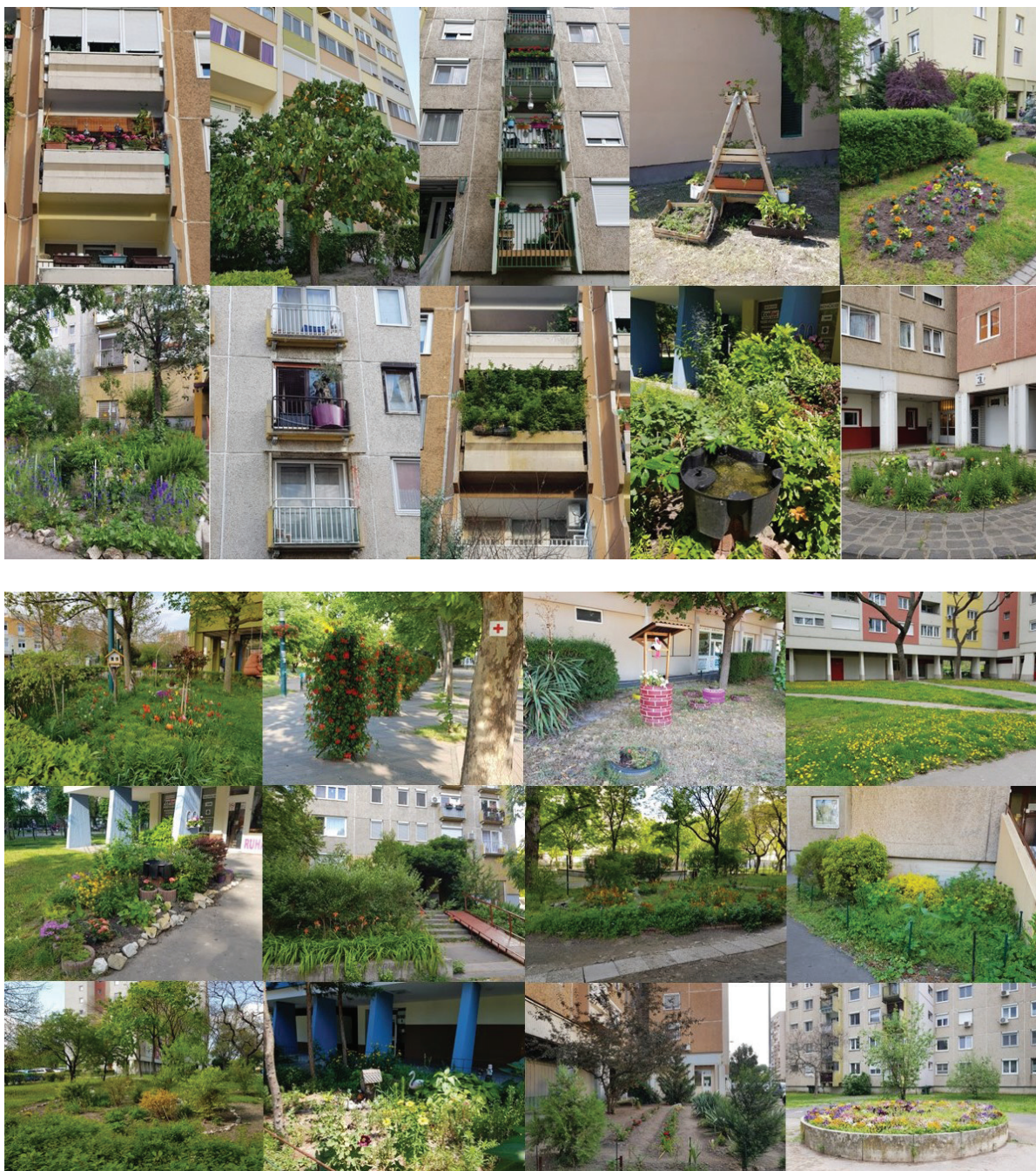
6. ábra Képek a zöldülő Békásmegyerről

A domborzati viszonyoknak köszönhetően kertünk néhány méterrel magasabban helyezkedik el az épület alapszintjéhez képest, egyedivé és jellegzetessé téve ezzel a helyszínt. (8. ábra)