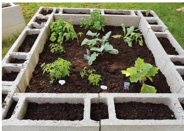
20. ábra Minta tankert az Ezüsthgyi Könyvtárban

A fűszer- és gyógynövénykert ötletéből kiindulva, egyben az egészséges táplálkozás fontosságát hirdelve, herbateázó kényelmi szolgáltatást indítottunk. Gyógynövény teakeverékekből gyógytea készítését és fogyasztását nyújtjuk ingyen a látogatók részére a hideg hónapokban a könyvtári tartózkodás ideje alatt. A gyógytea-alapkészletet gyógynövényboltokból szereztük be, de a teázó valójában közösségi alapon működik, vagyis az olvasóktól ajándékba kapott teafüvekkel, mézzel egészült ki