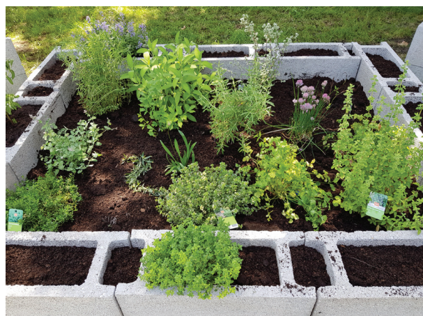
19. ábra Fűszer- és gyógynövénykert az Ezüsthgyi Könyvtárban

Bár az iskolai tankertek létesítése az utóbbi években egyre fontosabbá vált az oktatási intézmények életében, a lakótelepi iskolákra jellemző betonozott udvarokon nem mindenhol adott a lehetőség kivitelezésükre. Könyvtárunk vállalta, hogy