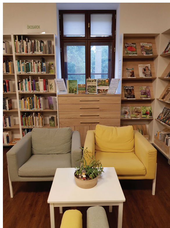
16. ábra Felnőtt és gyerek ökosarok-különgyűjtemény