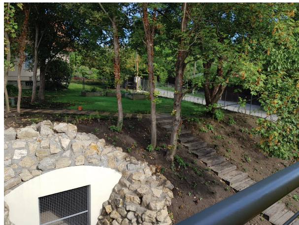
8. ábra Az Ezüsthegyi Könyvtár kertje