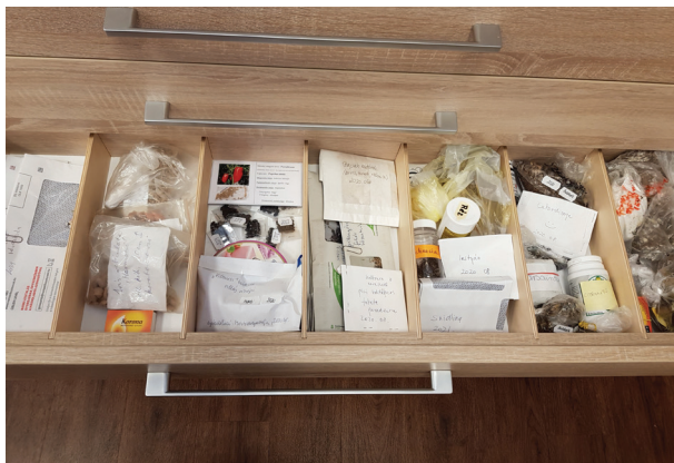
24. ábra Kölcsönzés után visszahozott magok

-rendszerező kompetenciái alapvető fontosságúak abban, hogy minden esetben szolgáltatassunk elegendő információt a növényekről, hiszen csak ezek alapján tudják a kevésbé gyakorlott kertészek eldönteni, érdemes-e egyáltalán elvinni a növényt. A szolgáltatás szezonális: jellemzően tavasszal és ősszel érkeznek a „kis árvák”. A föld nélküli töveket és palántákat vízkultúrásan gondozzuk addig, amíg gazdára nem találunk. (25. ábra)