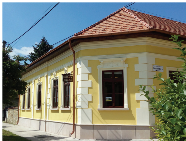
1. ábra Az Ezüsthelyi Könyvtár ma

Program keretében megkezdődött az Ezüsthely u. 16. szám alatti, évek óta üresen és elhagyatottan álló ház felújítása és átalakítása könyvtári funkcióra. (3. ábra)