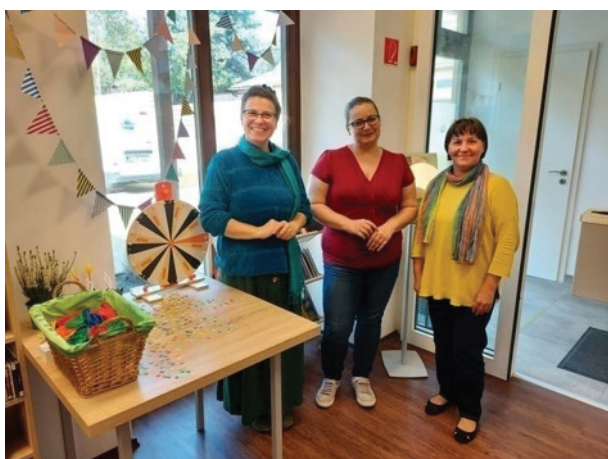
11. ábra Az Ezüsthgyi Könyvtár munkatársai

Végül, de nem utolsósorban a korábban említett intézményi elköteleződés mellett formálódott egy zöld szemléletre fogékony, kreatív csapat is. A munkájukat az Ezüsthgyi Könyvtárban megkezdő könyvtárosok egybehangzó közös célja volt az öko specializáció támogatása. Így lehetett a kezdetektől zöldkönyvtár Óbuda „új” könyvtára. (11. ábra)