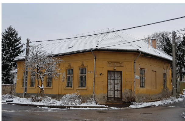
3. ábra Az Ezüsthegy utca 16. sz. alatti épület évek óta elhagyottan állt

Már a költözés előtt láttuk, hogy „új” könyvtárunknak sajátos adottságai lesznek, amikre alapozva zöldkönyvtárként kezdhetjük meg működésünket. Tisztában voltunk kivételes helyzetünkkel, hiszen sok közintézménynek nem adatnak meg ilyen feltételek, ezért arra törekedtünk, hogy minden adottságot céljaink szolgálatába állítsunk és minimálisra csökkentsük az eltékozolt lehetőségek számát. A felkészülésben segített minket, hogy központi könyvtárunkban, az Óbudai Platán Könyvtárban már 2016-ban megfogalmazódott intézményi szinten a környezetvédelem iránti elköteleződés. Voltak tehát jól bevált példák és a zöldszolgáltatások bevezetéséhez kapcsolódó közvetlen tapasztalatok. Létrehoztunk egy Ezüsthegy-team nevű projektcsoportot, aminek legfontosabb feladata az új könyvtár állomány-összetételének, működési feltételeinek, szolgáltatásstruktúrájának és rendezvénykonceptiójának kialakítása volt. Mindezt a környezettudatosság jegyében. Szükség volt erre azért, mert a korábbi fiókkönyvtárban ugyan voltak zöldülést célzó lépések, mint például a szelektív hul-