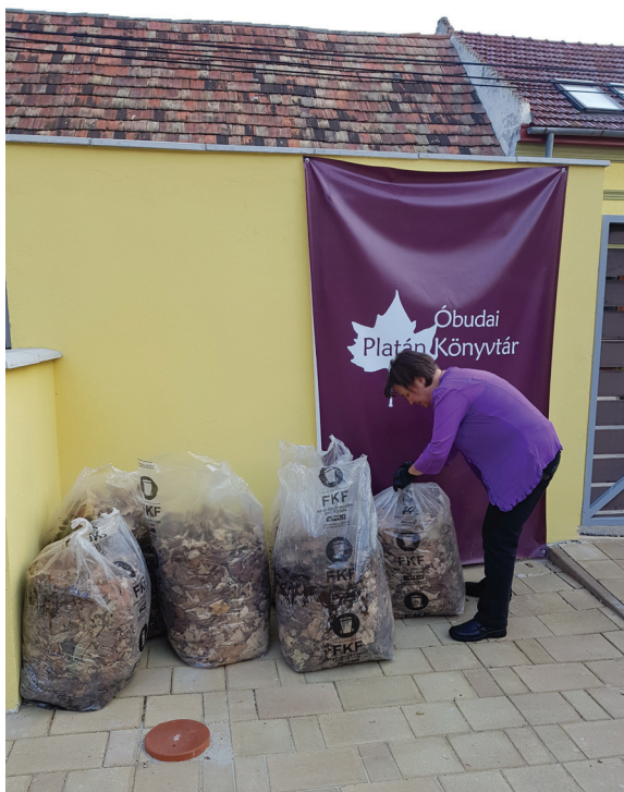
12. ábra Zöld kampányok az Ezüsthelyi Könyvtárban

Könyvtárunkban bevezettük a szelektív hulladékgyűjtést mind a bel-, mind a kültéren. A komposztálható hulladékot a kertünkben található komposztálóban gyűjtjük és felhasználjuk tantermeink és fűszerkertünk gondozásához. Ahogy az esővizet sem hagyjuk kárba veszni, az esővízgyűjtő-tartály tartalmával öntözzük az udvari ágyásokat és balkonnövényeinket, csökkentve ezzel is a vezetékesvíz-használatot. A zöldhulladék mellett, használt sütőolaj és használt elem gyűjtőpont is lettünk. (14. ábra)