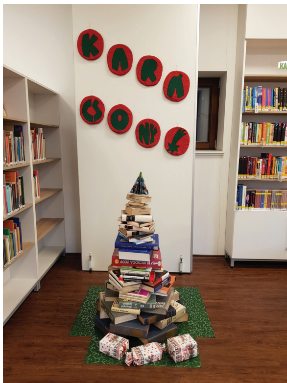
15. ábra A környezettudatos mindennapok

Az állományunk mellett a rendezvényeinket is „zölddé” tettük. Kialakítottuk az öko szemléletű könyvtári rendezvénykonceptiókat. 2018 óta a koronavírus-járvány megjelenéséig folyamatos volt előadásorozatunk „Gyógynövényekkel a testi-lelki egyensúlyért” címmel, amiben Polyák Ágnes gyógynövény-botanikus szakértő volt az állandó partnerünk. A pandémia alatt a többi könyvtárhoz hasonlóan online folytattuk az előadásokat, majd 2021 őszől „Ezüsthegy Kincsei” címmel ismét jelenléti programsorozatban gondolkodhattunk, amit 2022-ben egy sikeres NKA-pályázatnak köszönhetően folytattunk. Zöldkönyvtári rendezvény-