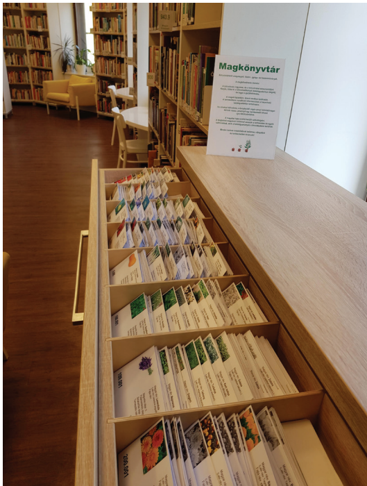
23. ábra Magkönyvtár az Ezüsthegyi Könyvtárban