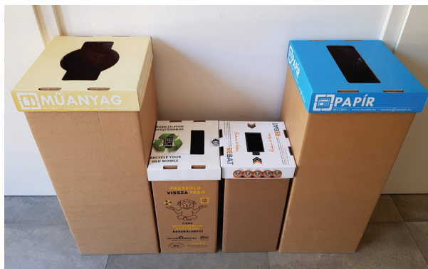
14. ábra Szelektív hulladékgyűjtés beltéren, kültéren