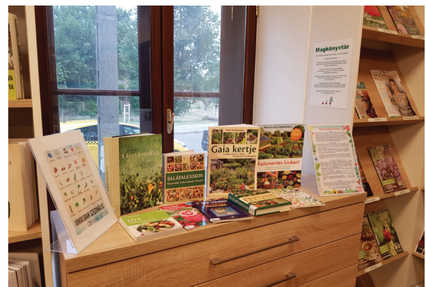
26. ábra Kerti notesz az Ezüsthegyi Könyvtárban