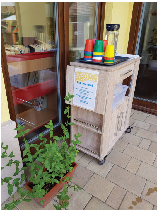
22. ábra Limonádézó az Ezüsthelyi Könyvtárban

A könyvtárak mint a szellemi tudásvagyon gyűjtői, feldolgozói, őrzői és szolgáltatói évszázadok óta teljesítik küldetésüket. A magbankokat szintén saját szakterületük „vagyonának” gyűjtése, a ritka leletek mentése, a növényvilág fajtáinak megőrzése vezérli. A magkönyvtár egy speciális kezdeményezés, ami a fenntartható fejlődés célkitűzéseit szolgálja könyvtári környezetben. A magkönyvtárak a magbankok és könyvtárak ötvözetei. Céljuk a helyi közösségekre, a vonzaskörzet lakosaira alapozva a tájfajta növényvilág megőrzése, a magok adományozásának és cseréjének segítése, az otthon termesztett haszon-, dísnövény és a hobbikertészkedési kedv erősítése, a növénynevelés lépéseinek támogatása, valamint a közösségépítés. Egyben megalapozzák és erősítik a természetes és termesztett növényvilág iránti felelősséget, a környezet- és klímatudatosságot. Magkönyvtári szolgáltatásunk egyedülálló az országban. A magkönyvtár működése hasonló a dokumentumok kölcsönzési elvéhez. A kölcsönzés jelen esetben azt jelenti, hogy