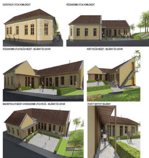
4. ábra Az Ezüsthegy Könyvtár látványterve

A két lakóközvet ugyan jellegében teljesen különbözik egymástól, mindkettőben megjelent az igény a szabadtéri, kerti szolgáltatásokra és mindkét közvet lakosai fogékonyak a zöld alternatívákra.