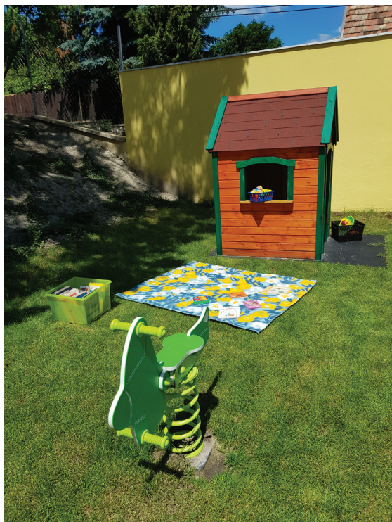
18. ábra Szabadtéri olvasóterem az Ezüsthgyi Könyvtárban

tér, udvar és kert. Különösen a lakótelepen élők körében erős az igény a szabad levegőn, zöld környezetben eltöltött szabadidős tevékenységekre, pihenésre. Köztudott a friss levegő, a kert és a zöld növények rekreációs, jótékony hatása a mentális, fizikális és pszichikai állapotra. A szabadtéri olvasóteremmel hozzájárulunk a stresszcsökkentéshez, a feloldódás előmozdításához. Nyugodt környezetet teremtettünk az elmélyülésre vágyók számára, ugyanakkor gondoskodunk a társas érintkezés feltételeiről is. A májustól októberig berendezett szabadtéri olvasóteremhez beszereztük és folyamatosan bővítjük a bútorokat: kültéri padokat, nyugágyakat, függőágyat, napernyőket, piknikpadot, plédeket. Az udvaron kialakított közösségi játszótér fő célja a gyermekes családok kapcsolatteremtésének elősegítése és megőrzése. A szabadtéri olvasóterem-szolgáltatáshoz a gyerekek részére a jó állapotú ajándékkönyvekből szabadtérben használható gyűjteményt képeztünk, és ezt folyamatosan frissítjük, cseréljük. A dokumentumokat a kerti játszótér mellett helyeztük el a kültéri játékokkal együtt. A felnőttek részére külön gyűjtemény nem készült, ők bemutatás után az állományba vett könyvtári dokumentumokat olvashatják a friss levegőn. (18. ábra)