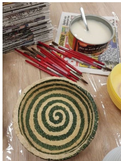
17. ábra Az Ezüsthegyi Könyvtár Öko-kreatív klubja

A rendezvényeken kívül összeállítottuk könyvtári tematikus zöldfoglalkozásainkat is, amit óvodai és iskolai csoportok is igénybe vehetnek. Kérés esetén a foglalkozásainkat személyre is szabjuk, annak megfelelően, hogy melyek a csoport előzetes ismeretei. Tavasztól őszig „Lombsátorozó” címmel öko játszótér tartunk a gyerekeknek a szabadteren. Emellett kerti táborokat, egyéb szabadtéri és kreatív programokat is szervezünk. Mozgókönyvtári szolgáltatásunkkal az „Ezüsthegyi Felfedezővel” külső rendezvényeken is részt veszünk.