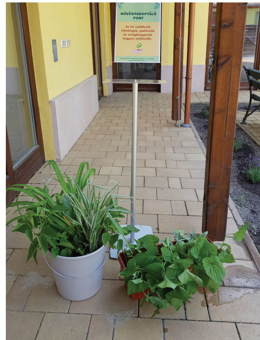
25. ábra Növényadoptáló pont az Ezüsthegyi Könyvtárban

Könyvtár vagyunk, csak egy kicsit másképp. Minden döntésünkkel azt szolgáljuk, hogy megvalósítsuk a könyvtári és zöldkönyvtári szolgáltatások harmonikus egységét. Egy olyan komplexi-