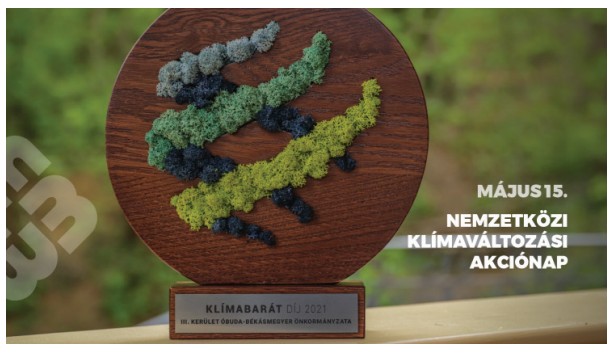
10. ábra Klímabarát Díj 2021