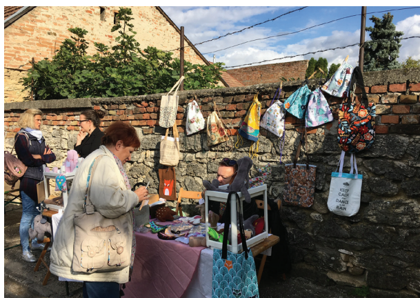
7. ábra Képek Ófaluról

Céljaink megvalósítását támogatta Óbuda-Békásmegyér Önkormányzata is, egy zöld projektekben rendkívül gazdag, környezetvédelemre érzékeny és gondoskodó fenntartó , aki kiemelten kezeli a környezetvédelem, a fenntarthatóság kérdését. A számos jó gyakorlatnak, környezetvédelmi-klimavédelmi programok települési megvalósításának és a hatékony szemléletformáló tevékenységének köszönhetően Óbuda 2022. május 15-én elnyerte a főváros legklimabarátabb kerülete címet. A pályázók olyan klímatudatosság iránt elkötelezett települések, amelyek rendelkeznek példaértékű intézkedésekkel, beruházásokkal vagy stratégiákkal, tevékenységük hozzájárul a természeti erőforrások fenntartható használatához, ezáltal természeti örökségeink megőrzéséhez. (10. ábra)