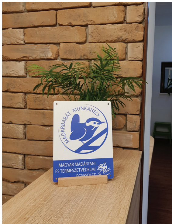
13. ábra Madárbarát munkahely cím

A könyvtári szolgáltatásokkal kapcsolatos szállítási feladatokat egy NISSAN e-NV200 Acenta Aut. 40 típusú elektromos autóval végezzük, és kiépítettünk egy e-töltőállomást a könyvtár udvarán az autó töltéséhez. A könyvtár udvarán található 4 férőhelyes biciklitárolóval arra ösztönözzük olvasóinkat, hogy autó helyett inkább gyalog vagy kerékpárral érkezzenek a könyvtárba. A 4 férőhely már a nyitáskor kevésnek bizonyult, ami azonban