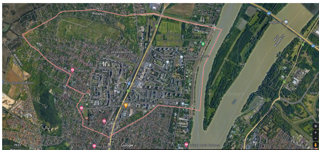
5. ábra Békásmegyér műholdas képe

A panellakásokban élők körében évek óta jellemző a növekvő érdeklődés a közösségi kertek művelése, az előkertek gondozása, a balkonkertészet, a „konyhakert erkélyen, lakásban” és a Slow Food mozgalom iránt. Ezt a törekvést a 3. kerületi önkormányzat is tartósan ösztönzi, a támogatás változatos formáit biztosítja, úgymint pályázatok útján az eszközök, palánták és egyéb kiegészítők beszerzése, zöldzsákok, esővízgyűjtők, komposztálók térítésmentes nyújtása. (6. ábra)