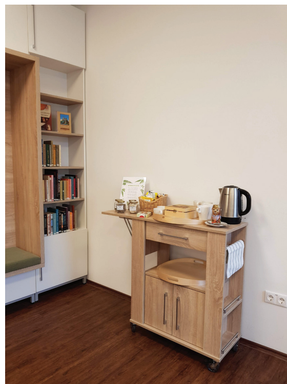
21. ábra Herbateázó az Ezüsthgyi Könyvtárban

A télen herbateázóként működtetett szolgáltatás nyáron limonádézó szolgáltatásra vált. A herbateázó szekrényt a veranda alá kigurítva frissen készült, hideg limonádé fogyasztását tesszük lehetővé látogatóink és a rendezvényeken résztvevők számára ingyen. Érdekessége, hogy a limonádét mindenki saját ízlése szerint ízesítheti a herbakertünkben külön erre a célra, balkonládákban nevelt citromfűvel és mentával. Az éppen termő balkonládát a limonádézó mellé helyezzük, majd miután „leszüretelték”, felvisszük a kertbe megerősödni és lehozunk egy másik, termő balkonládát. Ezzel a forgórendszerrel tudjuk egész nyáron biztosítani a friss citromfűvet és mentát. A limonádézó is hamar népszerű lett, olyannyira, hogy citromot és