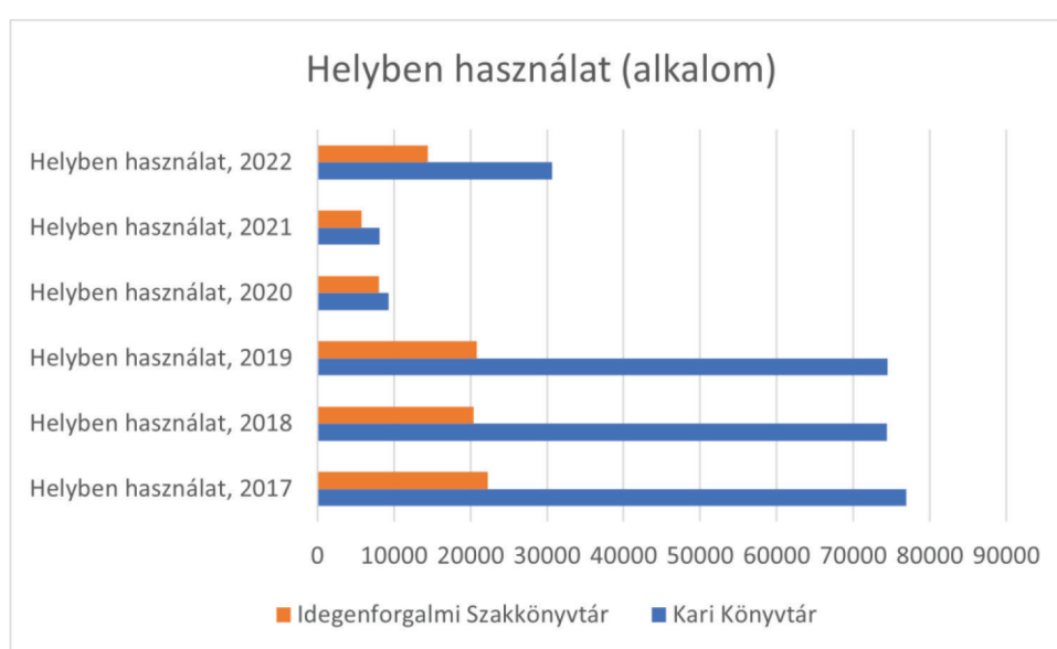
1. ábra Helyben használat a BGE KVIK könyvtárakban 2017 és 2022 között

A távhasználat kevésbé volt elterjedt a pandémia előtt, viszont a járványhoz alkalmazkodva mindkét könyvtár igyekezett áttenni a szolgáltatásait az online térbe, amit az olvasók vegyesen fogadtak: volt, aki nem örült, mert a személyes kontaktust preferálta volna a könyvtárosokkal. Másoknak viszont előnyös volt, hogy nem kell személyes jelenlét ahhoz, hogy igénybe vehessék a könyvtár szolgáltatásait: a kollégistáknak, a nem Budapesten élő levelezős hallgatóknak jóval egyszerűbb, hogy nem kell kimozdulniuk a kollégium-