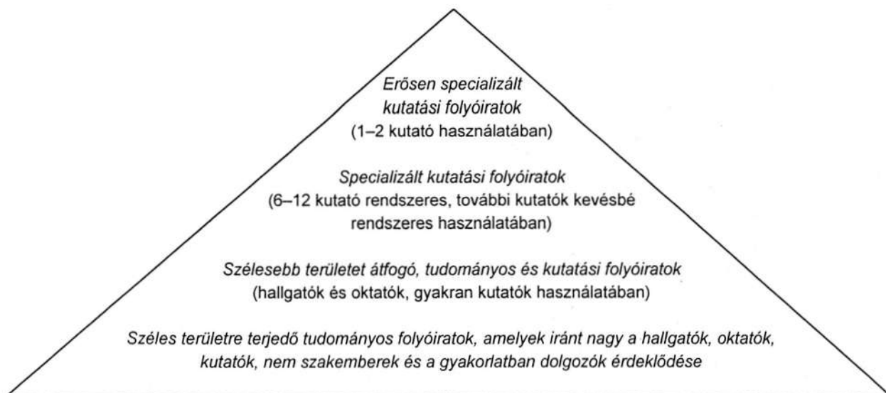
1. ábra A megosztott használat piramisa

A DFG képviselői kezdetektől fogva részt vettek ebben a vállalkozásban. A DFG képviselője már az első ülésen felvetette – amit mind a kutatóintézetek konzorciumainak a könyvtárai, mind egyes regionális konzorciumok is támogattak –, hogy a nagyobb egyetemi könyvtárak gondozására bízott szakterületek 19 külföldi folyóiratanyagának DFG-szponzorálása képezhetné az elektronikus folyóiratokkal való országos ellátás pénzügyi alapját, ha az országos licenclésről tárgyalásokat lehetne folytatni. Természetesen ehhez szükség volna az egyes tartományi kormányok (az egyetemek fenntartói) egyetértésére, s hozzá kellene járulniuk az országosan kialakított licenc költségeihez is, mivel a DFG-től eredő finanszírozás nem lenne elégséges. Ez a modell, amely országos keretet biztosítana a licencnek, nagyon hasonlítana a NESLI (National Electronic Site Licensing Initiative, Egyesült Királyság) által alkalmazott modellhez, legalábbis ami az elektronikus alapú tudományos folyóiratokat illeti. Az 1. ábra szemlélteti azoknak a tudományos és oktatási folyóiratoknak a megosztását 20 , amelyek tekintetében országos konzorciumos megegyezések – a címetek és a szakterületi specializálódást figyelembe vevő egyedi intézményi részvétellel – hozzájárulhatnának a költségek megindokolásához, csökkenthetnék a többszörös előfizetéseket, s egyidejűleg biztosítanák a szükséges információellátást.