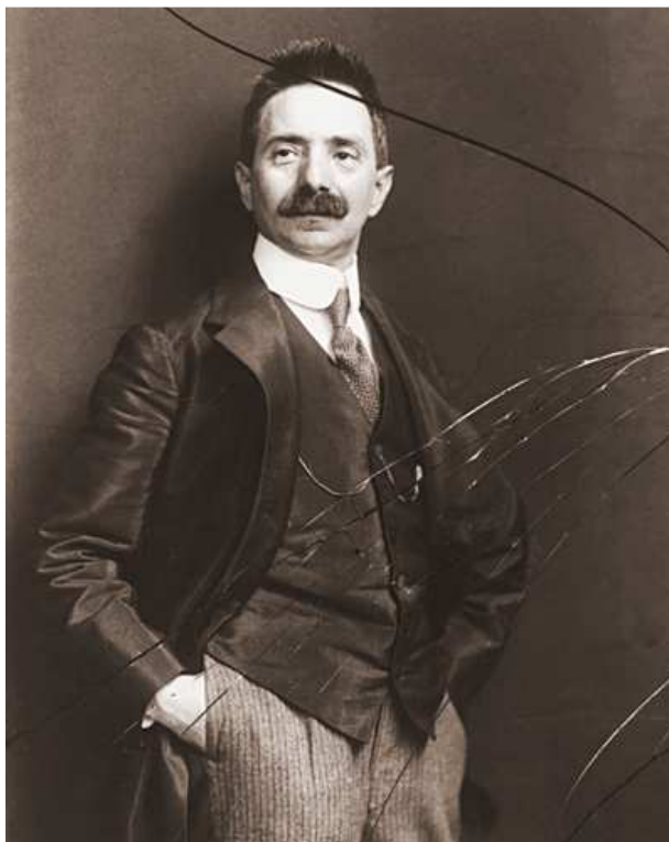
2. ábra Székely Aladár: Önarckép

A Képek, illusztrációk címet viselő, 76 tételt tartalmazó adatbázisban részben a fényképészet műfajának legjobb alkotásait (pl. Boros József 1850 körül készített Női képmás bársony mentében