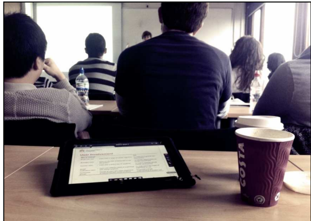
A kutyük azért az óráról már nem hiányozhatnak

Egyes vélemények szerint ez azért van így, mert a hallgatók sokkal jobban tudnak fókuszálni a hagyományos könyvekből való tanulásnál az anyagra, kevesebb a zavaró tényező (ugye a nyomtatott könyvek olvasásánál nem lehet egy kattintással a facebookra felmenni vagy filmet nézni inkább). De lehetséges az is, hogy a mostani főiskolás generációnak még nincsen igazi tapasztalata a táblagépeken és e-könyveken való tanulással kapcsolatban, hiszen ezek csak az utóbbi időben terjedtek el igazán. Az első állításnak ad igazat Jordan Schugar professzor, aki a West Chester Egyetemen tanít. Megfigyelte, hogy azok a diákok, akik e-könyv olvasóból vagy táblagépből tanultak, kevésbé teljesítettek jól a témát kikérdező teszteken, mint azok, akik nyomtatott könyveket használtak.