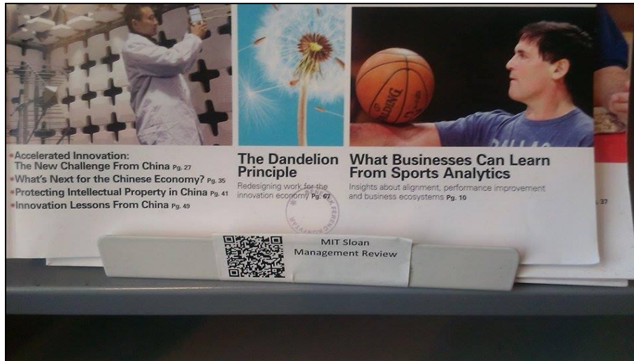
3. ábra A QR kód alkalmazása az időszaki kiadványoknál