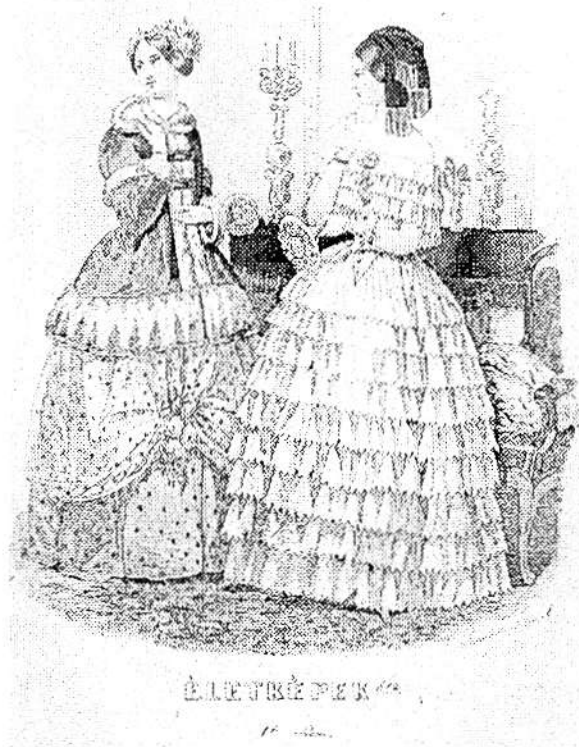
2. ábra Melléklet az Életképek ből