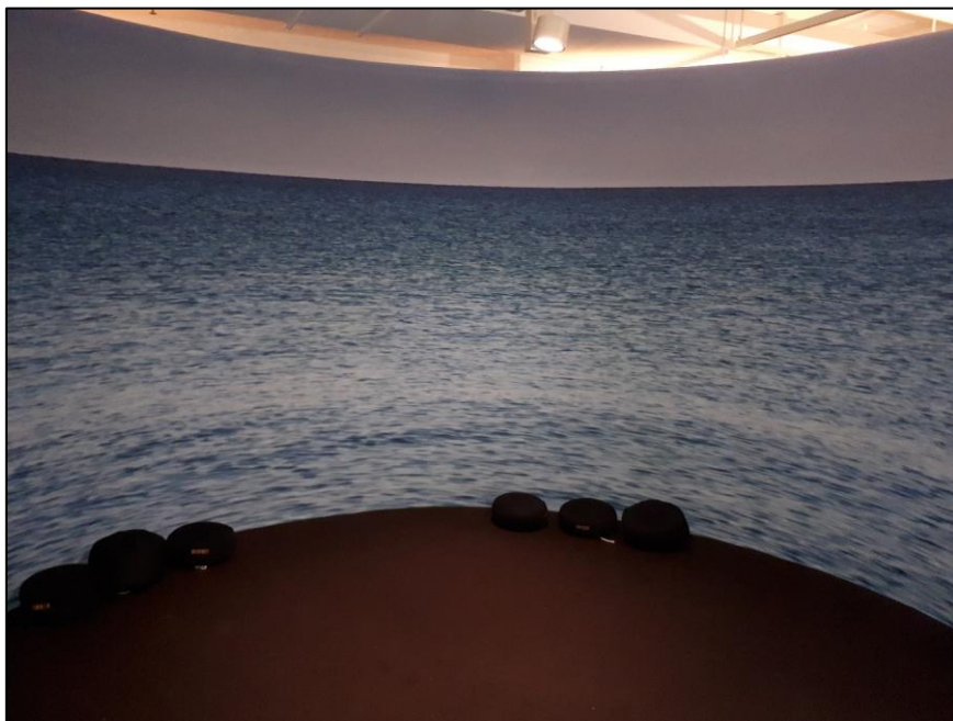
7. ábra Meditációs szoba a DET KGL-ben

A tizenhét emeletes épületben jól kiegészítik egymást a legmodernebb technikai eszközök és a hagyományos kézikönyvek az olvasóteremben, a bekötött folyóiratok forma (!) és nem szakrendben való katonás sorai a raktárakban, a látogatók előtt elzárt ritkaságok (pl. második világháborús, feltáratlan német dokumentumok).