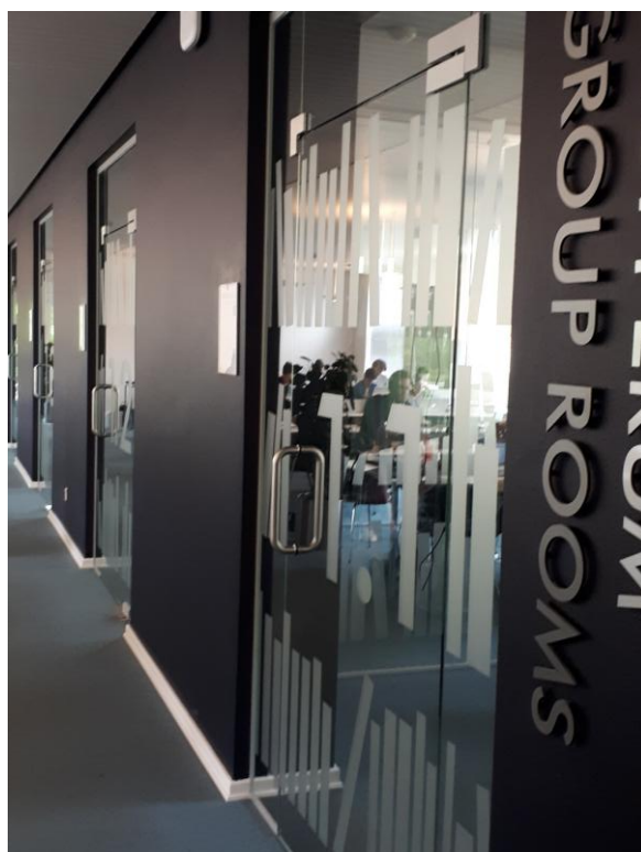
6. ábra Tanulósobák a DET KGL-ben

A könyvtár szellemisége hasonló a Dokk1-ben megtapasztaltakhoz: rugalmas terek, kikapcsolódásra, feltöltődésre alkalmas csendesebb, és a közös tanuláshoz, csapatmunkához elengedhetetlen kisebb-nagyobb állomások. Van itt pingpongasztal, konyha, meditációs szoba, masszázsfotel, multimédiás fotel, csocsó és szabadon használható fénymásoló, szkennelő, nyomtatógépek (7., 8. ábra).