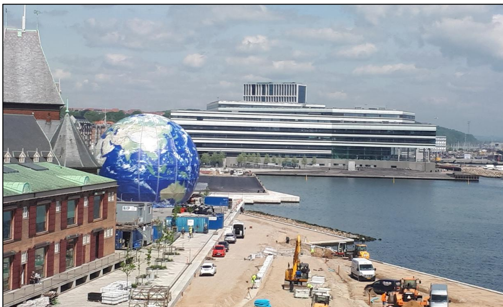
8. ábra Kilátás a Dokk1-ből a formálódó új aarhusi városrészre

Aarhus bár csak egy 330 ezer lakosú város az amúgy sem túl népes skandináv államban, de a Dokk1-gyel és az egyetem nemzeti könyvtárával együtt a világ kulturális és oktatási szempontjából egyik legmodernebb, leginnovatívabb szereplője. Szemléletük, stratégiájuk bár a magyar viszonyok között ma még egy nagyon távoli álmokkép, de a jövő könyvtárai bizonyára ezt a mintát követik majd.