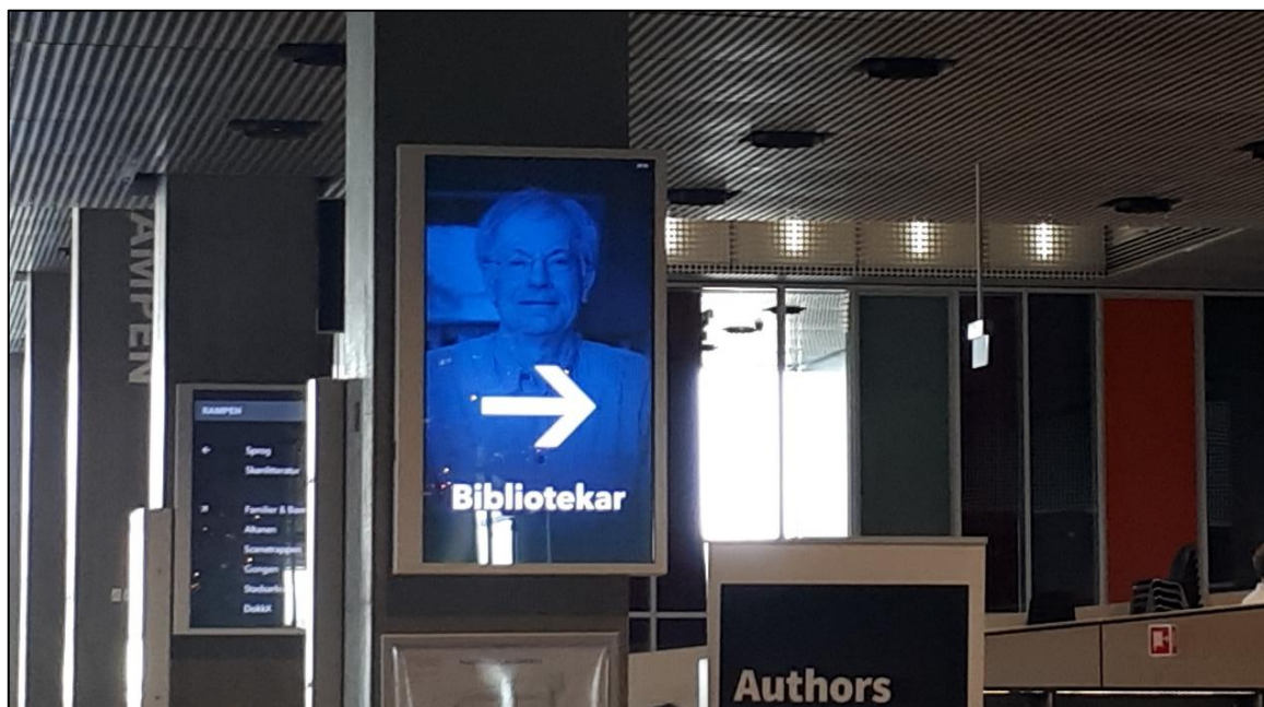
5. ábra Ma ő van szolgálatban

különleges saját fejlesztés: a book guide. Ez egy olyan könyvajánló szoftver, mely nemcsak olvasni-valót ajánl az adott részlegen belül, de a kiválasztott könyvnek megmutatja a pontos helyét is, az útvonallal együtt. Ezek az érintőképernyős eszközök csak az adott részleg témaköreit mutatják, és sajnos csak dán nyelven működnek, így részlete-sen nem tudtunk megismerkedni velük (5. ábra).