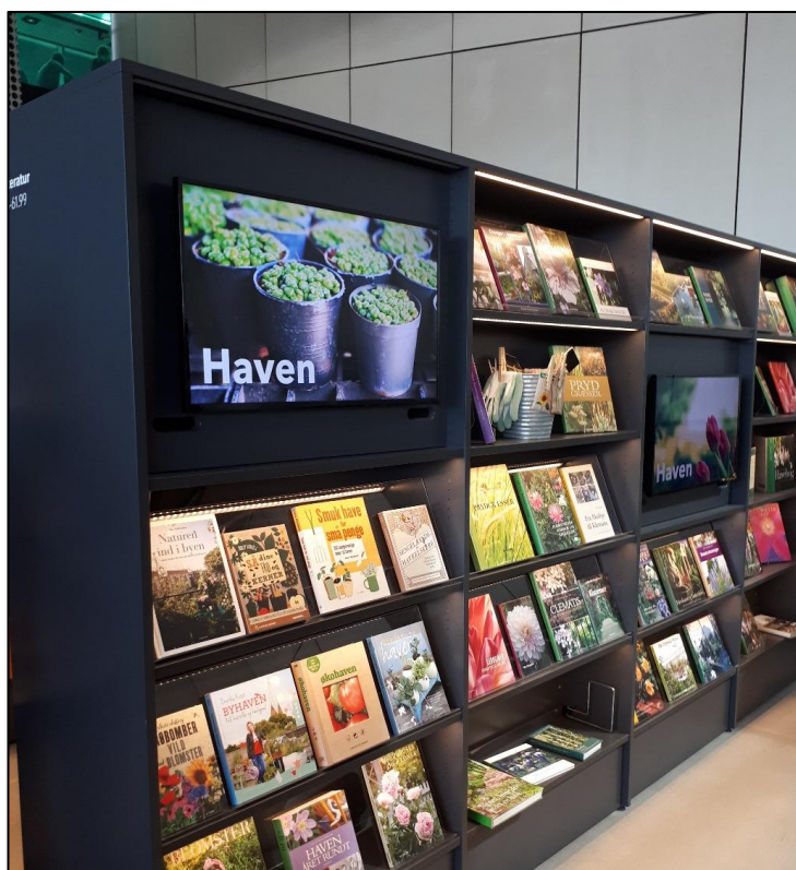
2. ábra Hangulat, design és multimédia minden négyzetméteren a Dokk1-ben