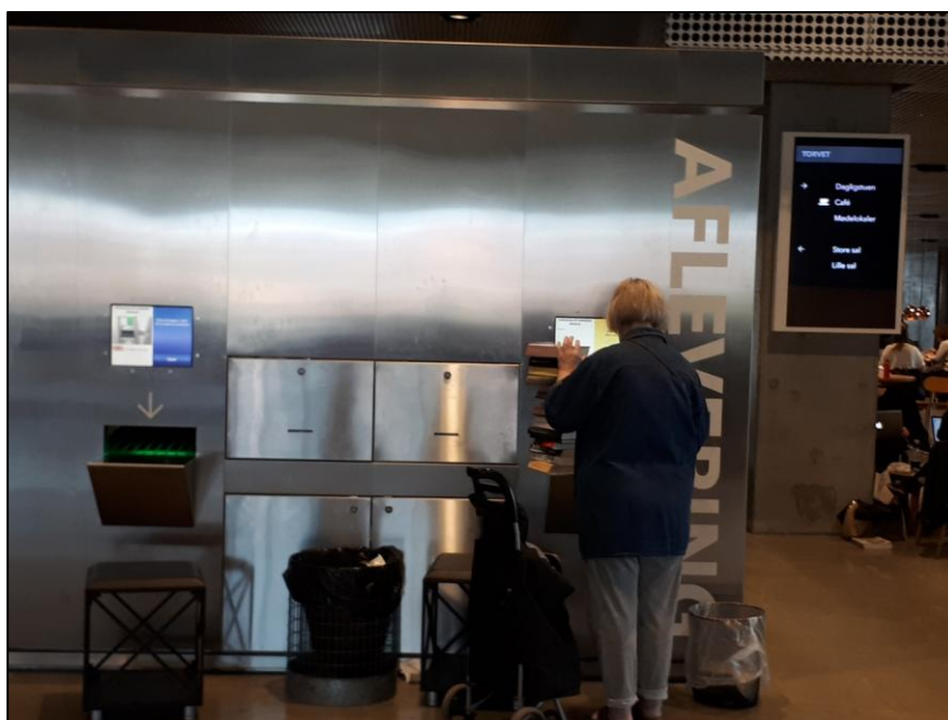
3. ábra Könyvkölcsönző gép a Dokk1-ben

A dán könyvtári stratégia nagyon erősen épít az önkéntesekre és a partnerekre: évente 2000 programot szerveznek a Dokk1-ben, amiben eltér a magyar szokástól az az, hogy a fogadott rendezvények számára is ingyenes a helyhasználat, eszközhasználat. Saját programjuknak tekintenek mindenféle külsős foglalkozást is, közös felületeken hirdetik a könyvtárosok által szervezett kulturális programokkal. A programok között kiemelt jelentőségűek a családoknak szóló események, (nekünk legjobban a baba-papa klub tetszett). Knud külön hangsúlyozta, hogy a Dokk1 elsősorban családkönyvtár, ami a szolgáltatások mellett az épület kialakításában is tetten érhető. A citizens' services révén a könyvtárak rengeteg olyan emberrel is kapcsolatba kerülnek, akik egyébként nem könyvtárhasználók, az okmányiroda minden általunk látogatott intézménynél szervesen belesimul a környezetbe, így a hivatalos ügy miatt érkező emberek is használják a könyvtári szolgáltatásokat. Nagy előnye ennek a rendszernek, hogy a bevándorlók beilleszkedését elő tudják segíteni, itt egy helyen találnak meg mindent, ami segíti őket a kezdetekkor (4. ábra).