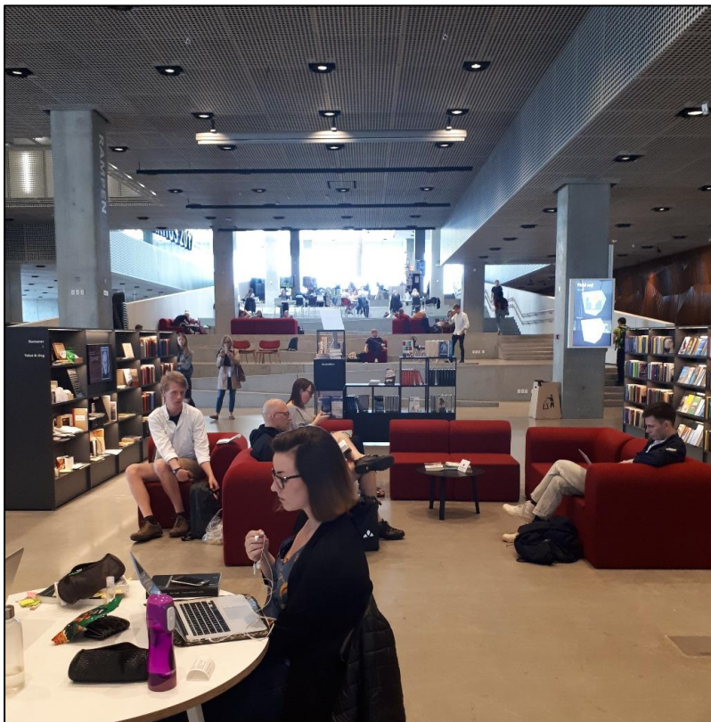
1. ábra A folyamatosan mozgásban lévő tér a Dokk1-ben