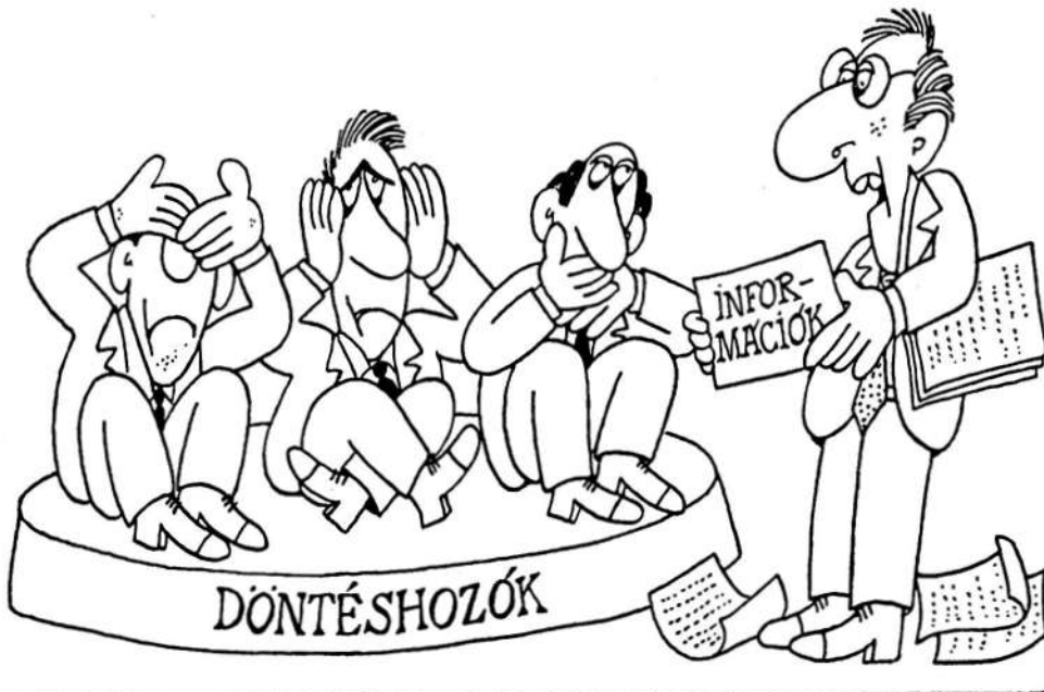
“Kellő információ nélkül lehet-e felelősen döntéshozóvá válni?”

Elmondta azt is, hogy “1949 óta a politika azt kényszerítette rá a Parlamentre, hogy ne legyen