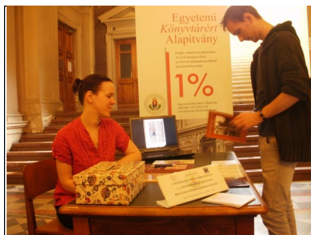
4. ábra Az ELTE BTK informatikus könyvtáros hallgatói által – projektmunka keretében – 2014 tavaszán létrehozott és működtetett 1%-os alapítványi kampánystand az Egyetemi Könyvtárban