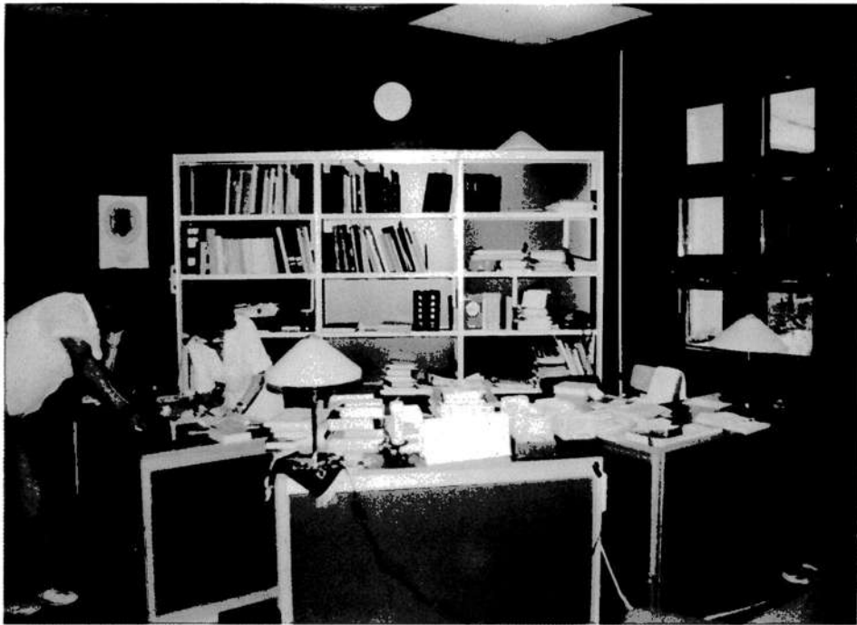
↑ 5. Olvasótermi pult