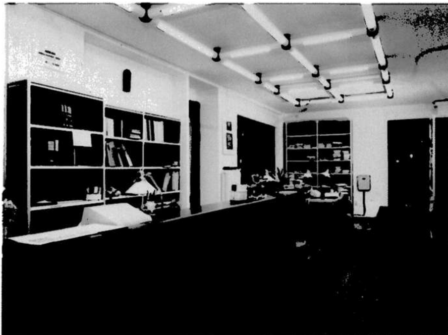
▲ 3. Kölcsönzőpult