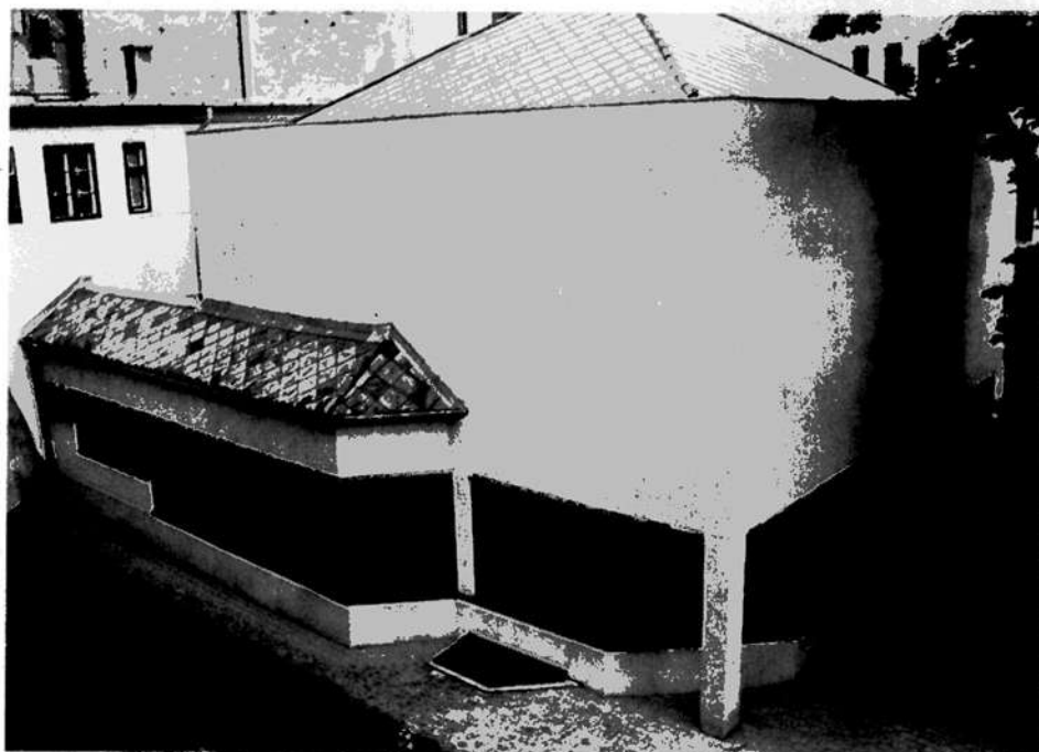
2. Az új épület a kert felől