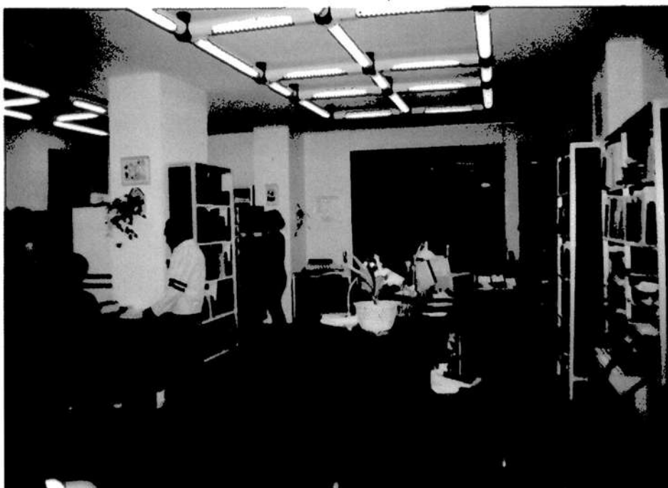
4. Kölcsönző katalógus szekrényekkel