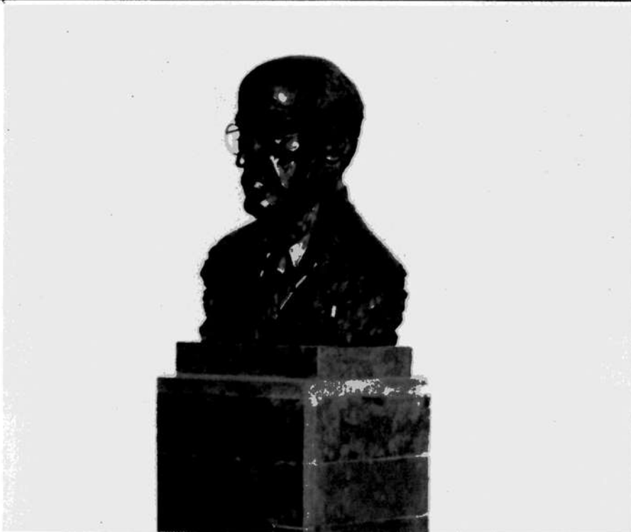
↑ 1. Károlyi Mihály mellszobra