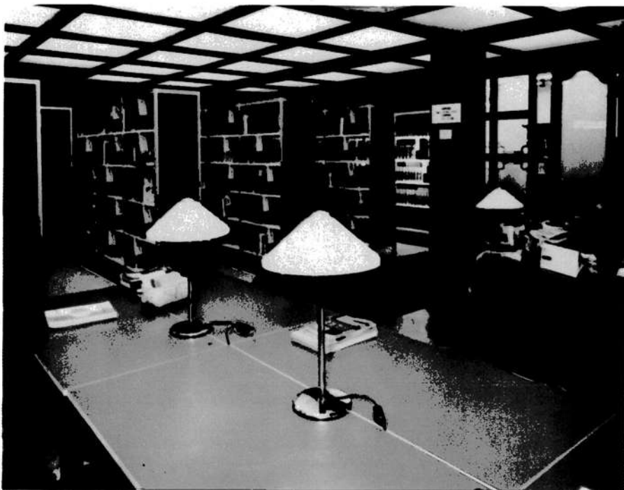
6. Olvasóterem ↓