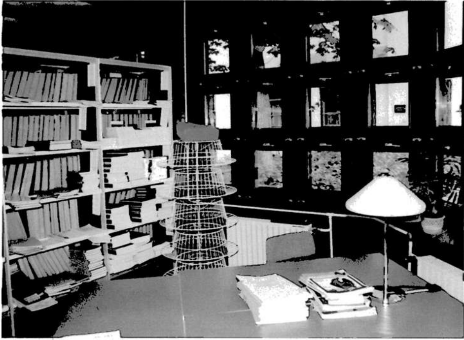
↑ 7. Olvasóterem részlete