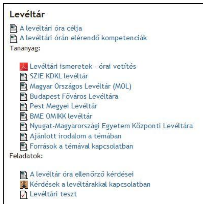
3. ábra A levéltár témakörének megjelenése az elektronikus keretrendszerben

Több program visszatérő eleme a könyvtári terek és szolgáltatások bemutatása. Bár ekkor a bemutató helyszíne nem levéltári tér, hanem a könyvtár olvasóterme, az egyik itt elhelyezett tárlóban folyamatosan a levéltárhoz kapcsolódó kiállítás látható, így a séta során röviden a levéltár és gyűjtőköre, szolgáltatásai is említésre kerülnek. Emellett a Nyitott Levéltárak rendezvényei során kiemelten a levéltár és szolgáltatásai a téma, így ekkor is alkalmunk adódik levéltári ismeretek, az önálló kutatás, a szellemi munka technikájához szükséges tudás átadására.