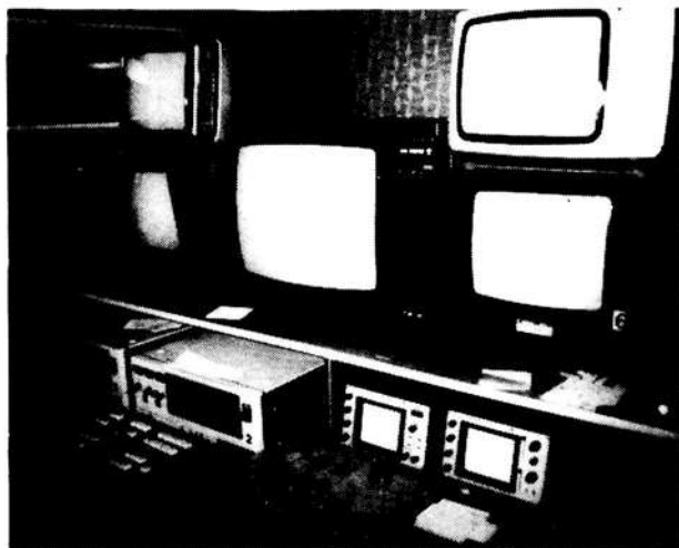
2. ábra Korszerű film- és videostúdió szolgál a képi információk terjesztésére

nyilvántartás mellett kutatási ajánlásokat készít a minisztériumnak, döntés-előkészítő tanulmányokat, szakirodalmi szemléket állít össze. Rendezvények, bel- és külföldi tanulmányutak szervezésével, film- és videoműsorok készítésével foglalkozik. E munkák mennyiségére jellemző, hogy évente mintegy 20 szakfilmet és 50–60 videoműsort készítenek, valamint 35–40 rendezvényt szerveznek (2. ábra). Tervezzük, hogy szakkiállításokon új technológiai eljárásokat, új műszaki megoldásokat mutatunk be. Ilyen komplex bemutatóval szeretnénk részt venni az európai állattenyésztők idén Budapesten megrendezendő kongresszusán.