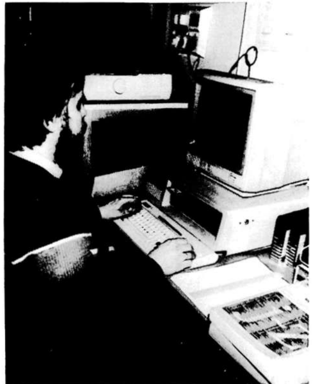
1. ábra A külföldi adatbázisokban való keresés közvetlen terminálkapcsolatokkal történik

◆ Intézményünk beszerezte a mezőgazdaság, az erdőszet és faipar, az élelmiszeripar, az élelmezéstudomány, a csomagolóstechnika és az alkalmazott biológia témakörében működő néhány számítógépes információs rendszer fontosabb szolgáltatásait. Az első, csereként hozzánk került adatbázis az AGRIS (International Information System for the Agricultural Sciences and Technology) volt, melyről 1977-ben kezdődtek a tárgyalások, egy évvel később pedig már beindult az erre épülő hazai SDI-szolgáltatás. (A FAO égisze alatt működő adattárba az Agroinform inputot szolgáltat a hazai ágazati szakirodalomról, és cserébe ezért megkapja az AGRIS-mágnesszalagokat.) Ezt követte a CAB (Commonwealth Agricultural Bureaux), majd az IFIS (International Food Information Service) mágnesszalagjainak megvétele. Ma már az említett adattárak alapján végzett havi szelektív témafigyelés mellett mód van az intézet terminálján a külföldi adattárakban való retrospektív online keresésre is (1. ábra). Az 1984-ben végzett online keresések