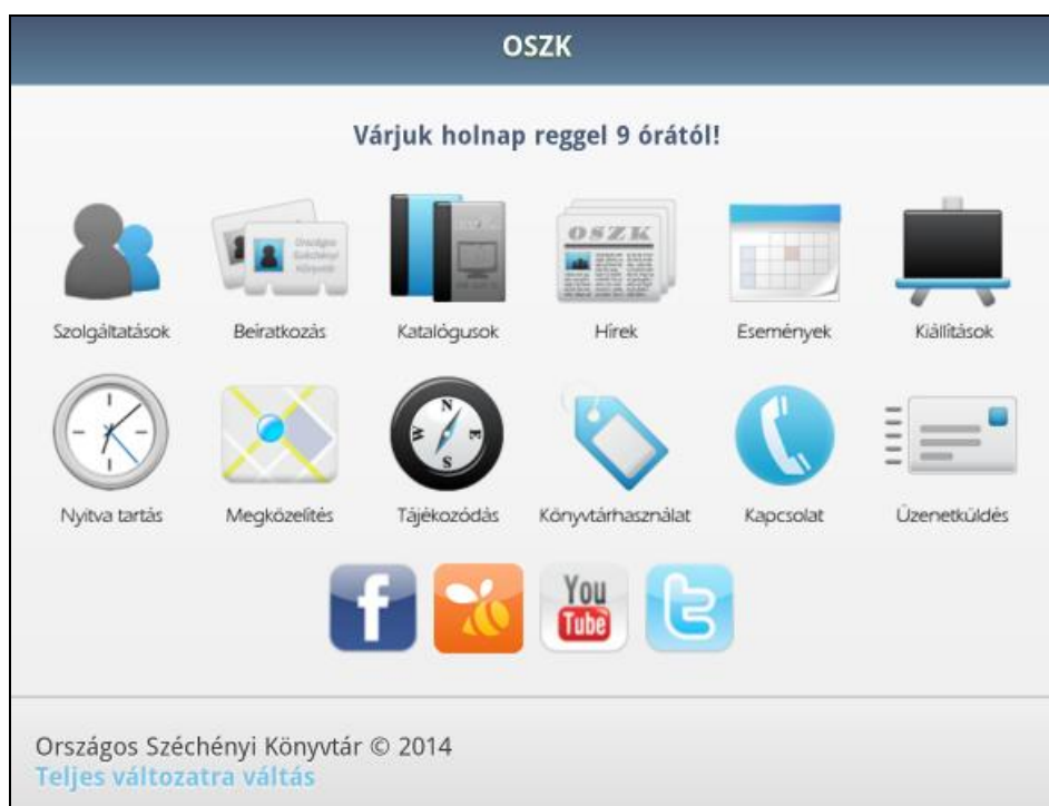
2. ábra Az OSZK mobil honlapja

nün keresztül lehet átnavigálni egyik oldalról a másikra. Valószínűleg annak köszönhetően, hogy már a fejlesztés idején is folyamatos, sok felhasználós tesztelés alatt állt a honlap, a hivatalos publikálás óta megbízhatóan üzemel.