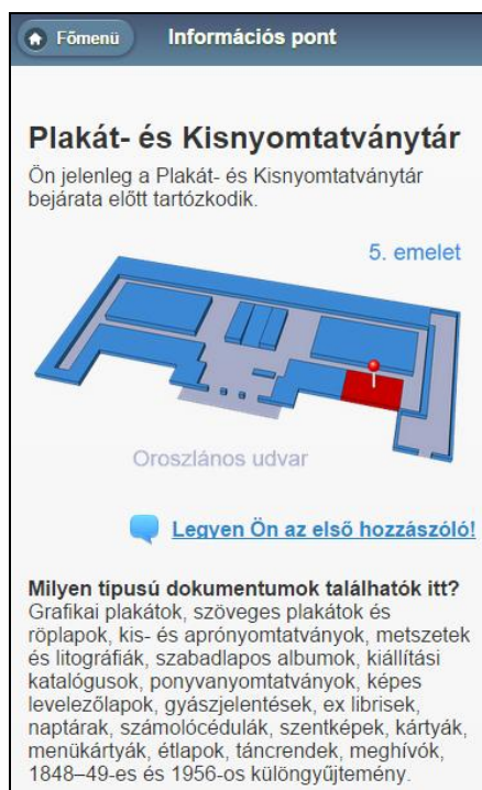
5. ábra Mobilkód beolvasásával megjelenő helyzetfüggő tájékoztatás

Az jövő mindenképpen erre mutat, rohamos terjedésük miatt egyre kevésbé halogathatjuk a mobilkészítékek támogatását. Ideje minél több könyvtárnak megtenni legalább a kezdő lépéseket ebbe az irányba.