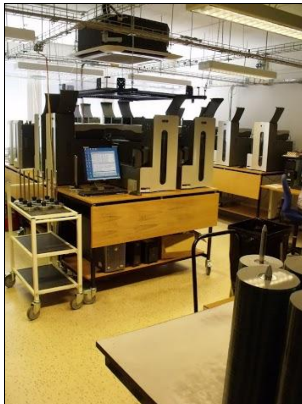
3. ábra NOTA – CD/DVD másoló

ul olyan, amely a felolvasás mellett kiemeli az olvasott szövegrészt. Fontos részlegük a telefonos és számítógépes támogatás. Használóiknak sokrétű segítséget nyújtanak, amely nemcsak az általuk küldött tartalom, vagy webes szolgáltatás eléréséhez kapcsolódik, hanem a tartalom használatához igénybe vehető eszközök működtetéséhez is, illetve az információhoz jutás egyéb problémáiban is igyekeznek segíteni, megoldást találni.