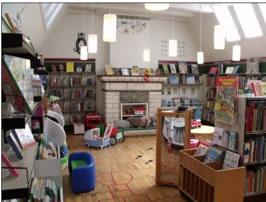
4. ábra Dragør Városi Könyvtár – gyerekrésztleg

Az e-könyvkölcsönzés nehézségei [16], a digitalizálás és szerzői jog problémái ugyanúgy megoldatlanok, mint a világon mindenütt, de a stabil és jól működő ingyenes szolgáltatások megkerülhetlenné teszik a könyvtárakat a dán társadalomban a jelenben és a belátható jövőben, ezért a lehető legtöbb mintát érdemes lenne átvenni és alkalmazni.