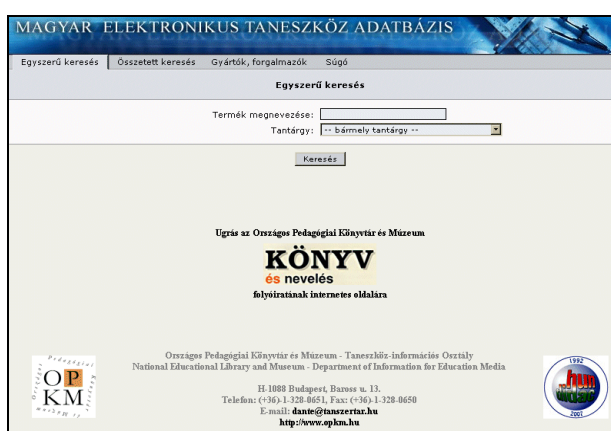
1. ábra A META kezdőlapja és egyben egyszerű keresője

Összefoglalva: A META jellegét tekintve különleges adattár, de máris kicsit elöregedettnek és elszigeteltnek tűnik. Mindenképpen több információ kellene a tartalmáról, az adattárba kerülő új tételekről, használóit be lehetne vonni a termékek véleményezésébe, és akár az adatok bővítésébe vagy kiegészítésébe is. Össze kellene kapcsolni más tanszerkatalógusokkal (pl. a már megjelenésében is sokkal vonzóbb www.taneszkozcentrum.hu -val), egyfajta közös katalógussá vagy portállá fejleszteni, hiszen a dinamikusan fejlődő oktatási iparnak nagyon hasznos volna egy olyan honlap, ahol nagyjából minden, hazánkban forgalmazott oktatási segédlet, szemléltető eszköz részletes és jól illusztrált leírása egy helyen megtalálható, és a termék akár meg is rendelhető.