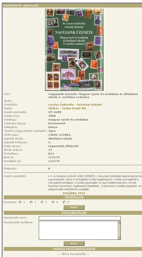
11. ábra Rövid találati lista

hogy a cím, tantárgy, kiadó, ár és értékelés oszlopokból álló lista bármelyik szempont szerint rendezhető, bár az utóbbi kettőnek még nincs sok értelme, mivel sokszor üresek (11. ábra).