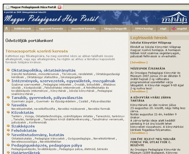
5. ábra Az MPHP portál nyitóoldala

A Magyar Pedagógusok Háza Portál célja „az oktató-nevelő munka, a pedagógiai innováció, a neveléstudományi kutatás számára készült hazai és külföldi elektronikus források rendszerezése, elérésük biztosítása”. Megvalósítása érdekében szerkesztői a portálon számba vesznek minden „minőségi információkat tartalmazó honlapot”, amelyet tartalmilag relevánsnak ítélnék. A tartalmakat kellően részletes csoportokba sorolva (például „Nevelés”, „Pedagógusképzés, pedagógus pálya”) böngészhetik a felhasználók.