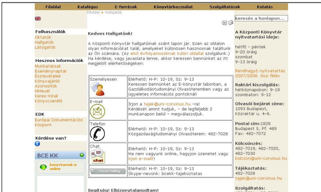
2. ábra A könyvtár honlapján a hallgatóknak kínált oldal