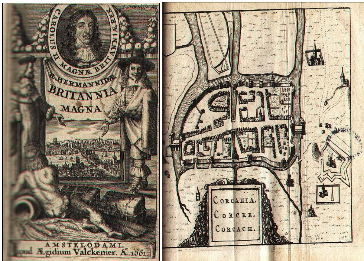
3. ábra Muzeális kötet címlapja és metszet a könyvből

A munka kiegészült a régi könyvek feldolgozásánál adódó, olyan többlet feladatokkal, mint gót betűs címek transliterálása, tulajdonbélyegzők azonosítása, possessor-bejegyzések rögzítése, ex librisek regisztrálása (2. ábra). A korai nyomtatványok azonosításának legbiztosabb módja, hogy a címlapokat, vagy a könyv egyéb részleteit digitalizált mellékletként csatoljuk a bibliográfiai tétel rekordjához (3. ábra). A Régi Muzeális (RM) téma címre kattintva a teljes, feldolgozott régi állomány végig böngészhető.