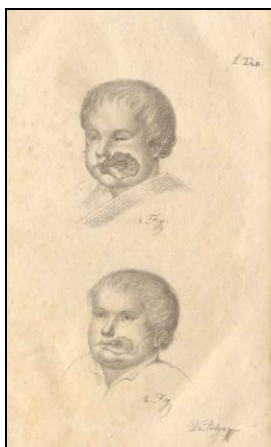
1. ábra Illusztráció Pólya József cikkéhez „I. tábla”

Dr. Pólya József (1802–1873): A' vízrák című cikke „hat ábrázolattal” az Orvosi Tár első évfolyamának legelső értekezése. Ezekkel szeretnénk színesebbé tenni közleményünket (1–3. ábra).