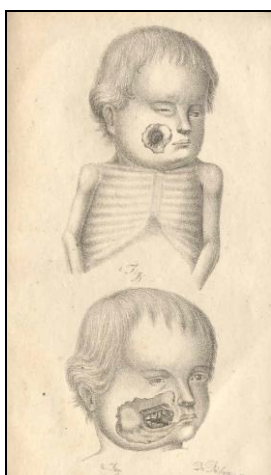
2. ábra Illusztráció Pólya József cikkéhez „II. tábla”