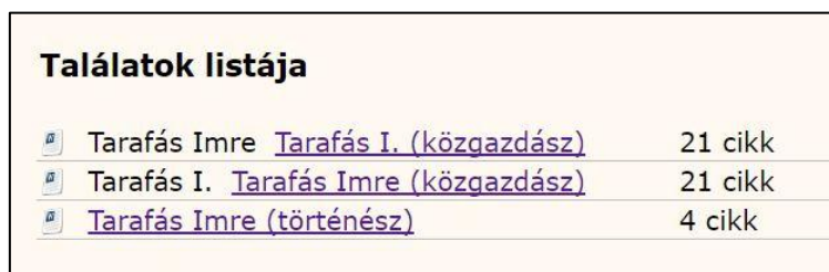
4. ábra Tarafás szerzőre keresve az eredmény a MATARKA-ban