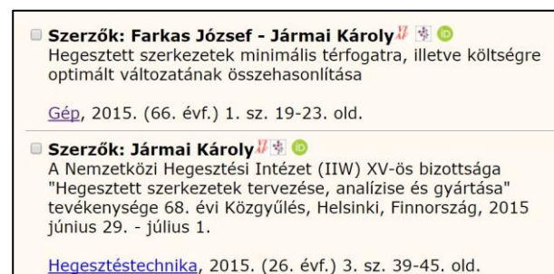
6. ábra Markerek a szerzők neve mellett