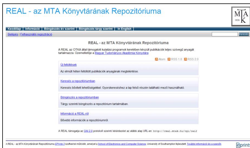
1. ábra A REAL nyitóoldala

Az OTKA (Országos Tudományos Kutatási Alapprogramok) 2009-ben olyan szabályozást fogadott el 5 , miszerint minden általa támogatott kutatóprogram tudományos eredményeit a Nyílt Hozzáférés (Open Access = OA) szabályai szerint hozzáférhetővé kell tenni. Azt ugyan nem szabta meg, hogy ezt milyen módon szükséges megtenni – valamely repozitóriumban való elhelyezéssel, OA folyóiratban, vagy hagyományos folyóiratban az OA lehetőség megvásárlásával –, de biztosítani kívánt egy olyan repozitóriumot, amelyben a cikkek – más lehetőség híján – mindenképpen elhelyezhetők. Ezen repozitórium felállítására kérték fel az MTA Könyvtárát (1. ábra). A szolgáltatás kiépítését anyagilag is támogatták. (Ugyanezt a repozitóriumot választotta az OTKA az általa támogatott kutatóprogramok pályázati zárójelentéseinek nyilvánosságra hozatalára és megőrzésére is.)