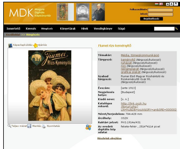
4. ábra A Magyar Digitális Képkönyvtár bemutató oldala

tók, mint a képeslapküldés és az ajánlás. Egyes szolgáltatások, mint a Kedvenc képek összeállítása és vetítése, vagy a másolatrendelés csak regisztrált használók számára érhetőek el.