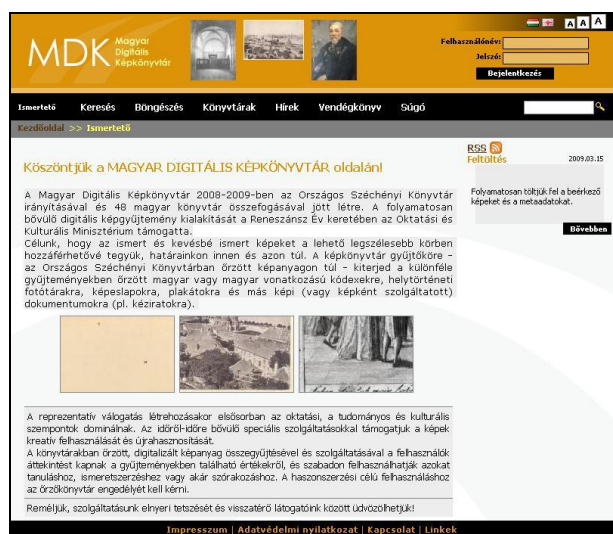
1. ábra A Magyar Digitális Képkönyvtár nyitó oldala

Az Oktatási és Kulturális Minisztérium (OKM) és az Országos Széchényi Könyvtár (OSZK) dolgozta ki a Magyar Digitális Képkönyvtár kialakítására vonatkozó javaslatot, majd ezt követően 2008 elején jelent meg az a 220 millió forint összértékű pályázat, amely a gyűjtemények meglehetősen széles körét szólította meg. A támogatásnak köszönhetően a könyvtárakban őrzött, már digitalizált képek összegyűjtésével és „egyponos” szolgáltatásával a felhasználók áttekintést kapnak a gyűjteményekben található értékekről, és szabadon felhasználhatják azokat magáncélra tanuláshoz, ismeretszerzéshez vagy akár szórakozáshoz (1. ábra).