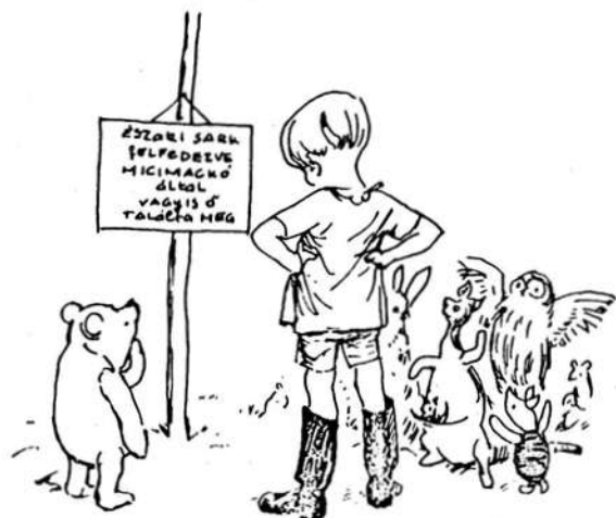
E. H. Shepard rajzai a mű eredeti kiadásából