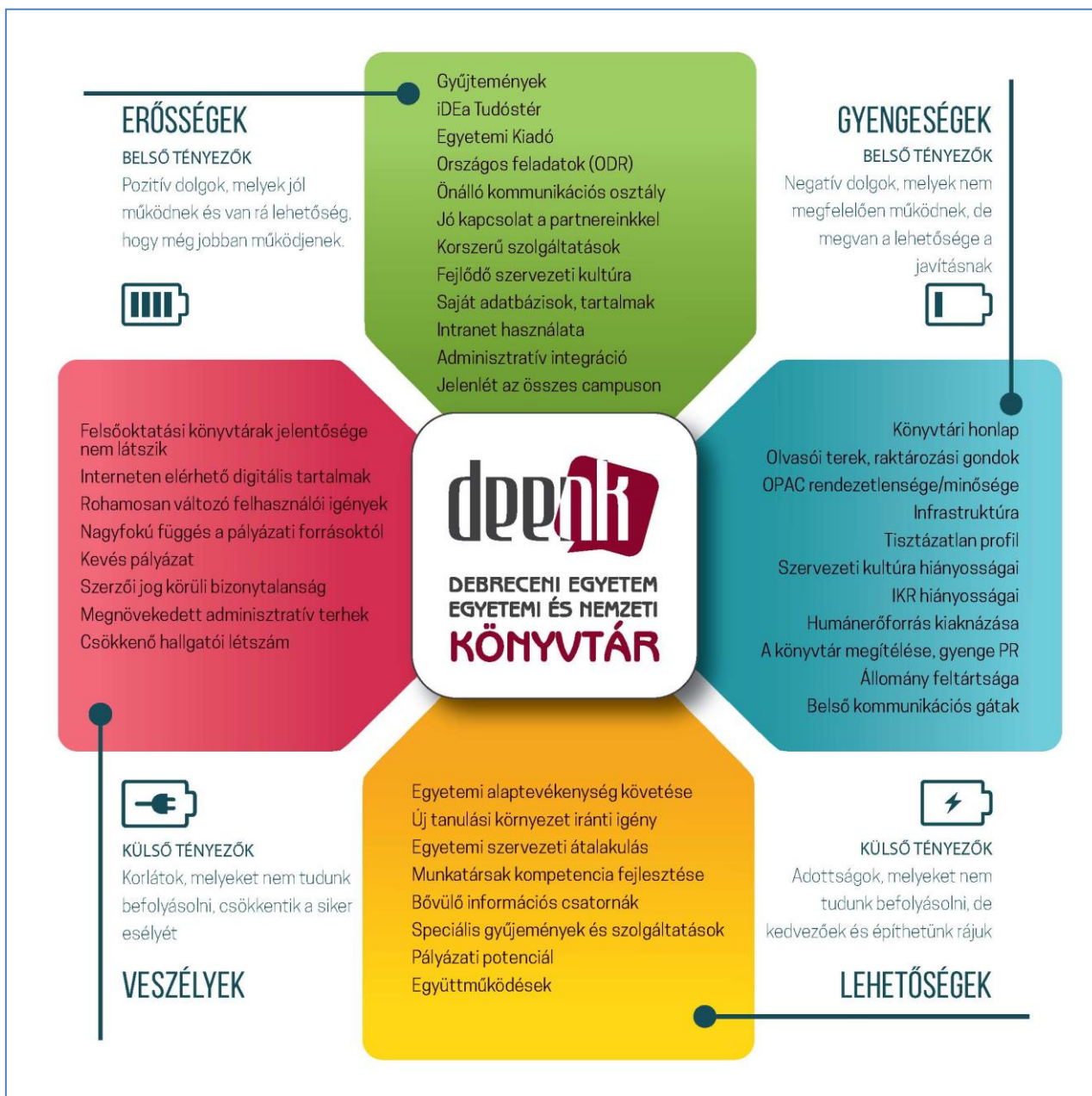
1. ábra DEENK SWOT 2016

Differenciáltan képzett munkaerőnk kompetenciáinak további fejlesztésével, a belső kommunikáció, valamint a szervezeti kultúra fejlesztésében rejlő lehetőségek kiaknázásával tovább erősíthetjük a felhasználó-központú szemléletet szolgáltatásaink tervezésében, szervezésében és közvetítésében. Kihasználjuk az egyre bővülő információs csatornákat és eszközöket, kapcsolódunk helyi, nemzeti és nemzetközi közösségekhez és szolgáltatásokhoz. Mindezt a speciális igényeket is kielégítő, személyre szabott funkciókkal tesszük emberközelivé.